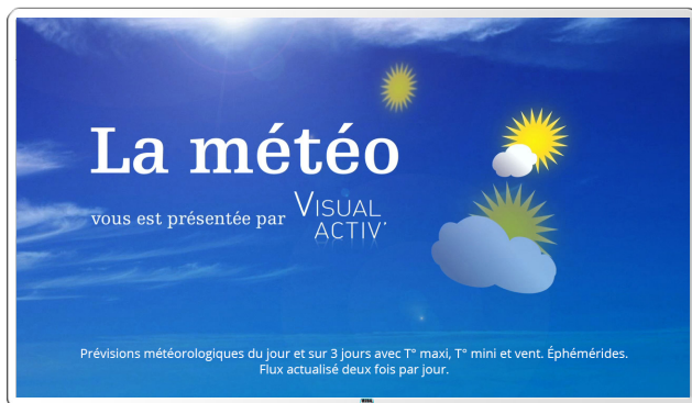
Flux d'informations, mise à jour automatique