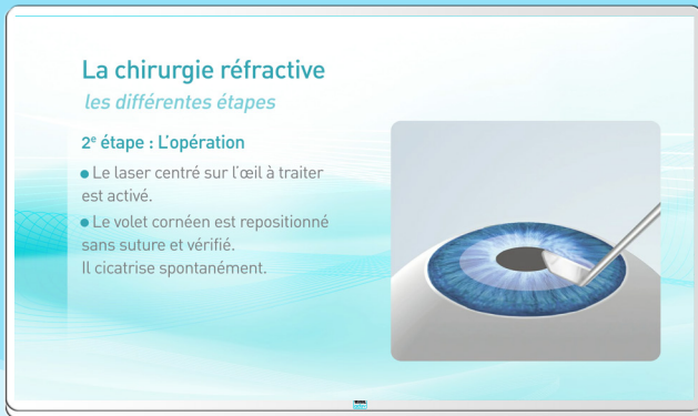
Clips aux contenus Médicales