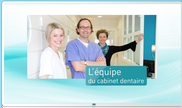
Présentation de l'équipe, du cabinet...